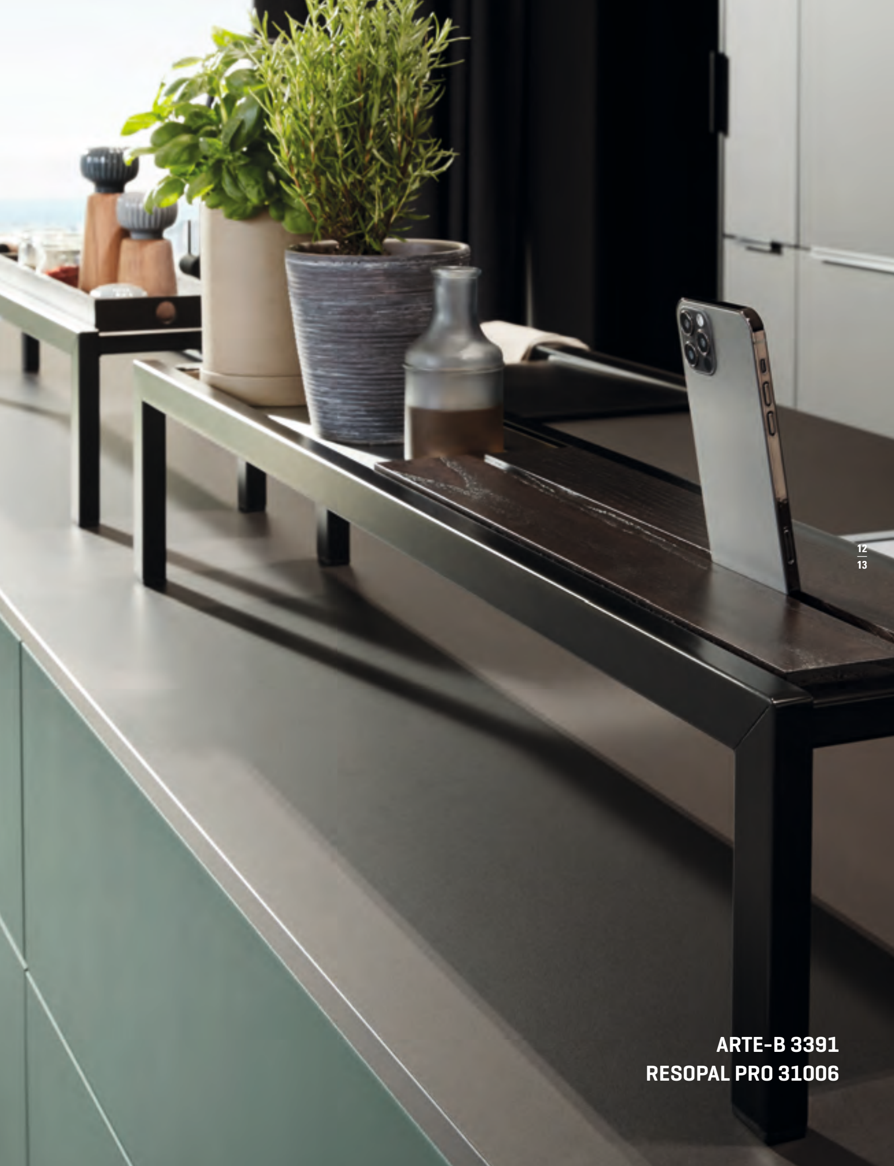
ARTE-B 3391 RESOPAL PRO 31006