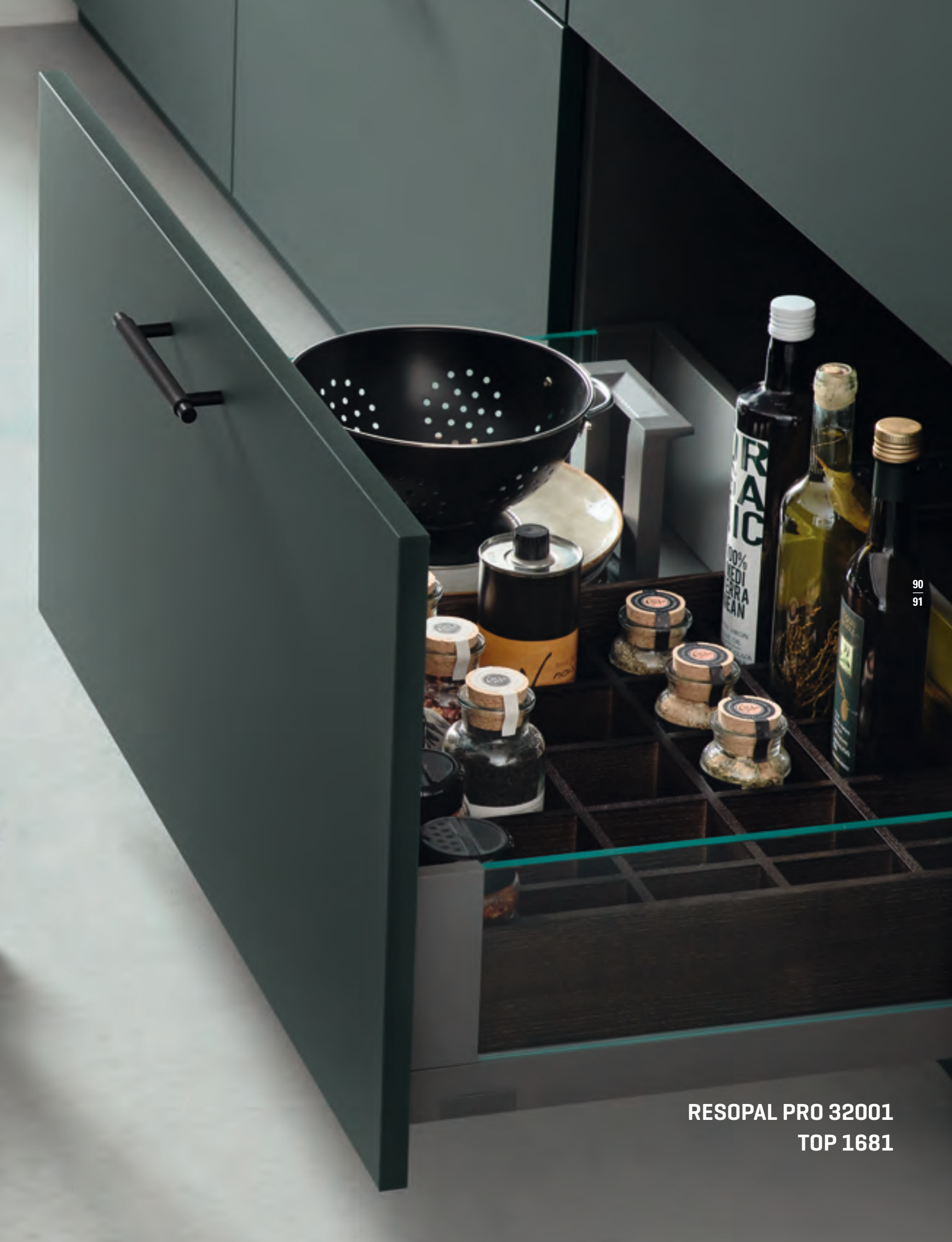
RESOPAL PRO 32001 TOP 1681