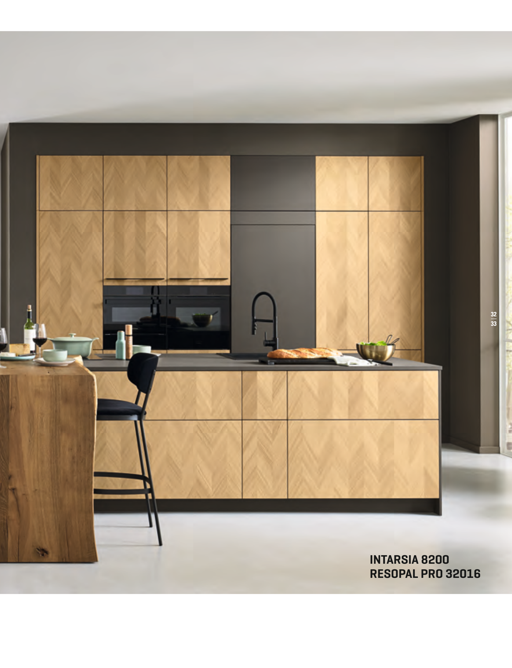
INTARSIA 8200 RESOPAL PRO 32016